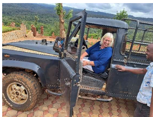
In en om de lodge