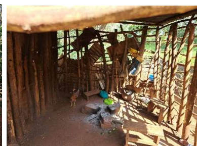
Binnen in de keuken