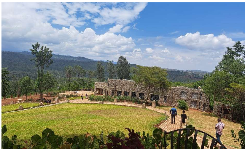
Uitzicht op de bossen van de Ngoro Ngoro krater

Je hebt contact én CONTACT. Contact zón der die bekende klik en CONTACT mét die bekende klik. U weet vast wat ik hiermee bedoel!