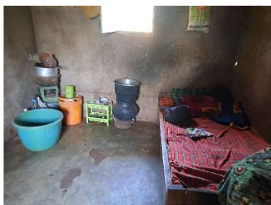
Slaapkamer met keukenspullen