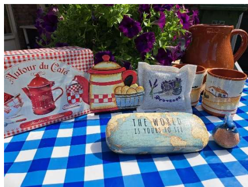
Met je blik op Frankrijk

In Frankrijk kom je als inwoner weer heel andere mogelijkheden en onmogelijkheden tegen. De zengende hitte die er nu heerst in Zuid-Europa is natuurlijk ook alles behalve aangenaam. De vele en gevaarlijke bosbranden maken veel mensen radeloos. Velen raken hun huis kwijt en waarschijnlijk ook hun werk. En hoe je toekomst er dan opeens uit komt te zien, is dan nog maar de vraag.