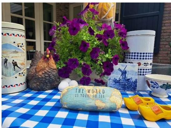
Met je blik op Nederland

Zo probeer ik dan ook vaak naar problemen in Afrika kijken. Problemen zijn er om opgelost te worden, maar ik realiseer me tegelijkertijd heel goed, dat er zeker ook problemen zijn die niet zijn op te lossen. Althans niet door mij! Dan moet ik het er maar bij laten, hoe vervelend ook.